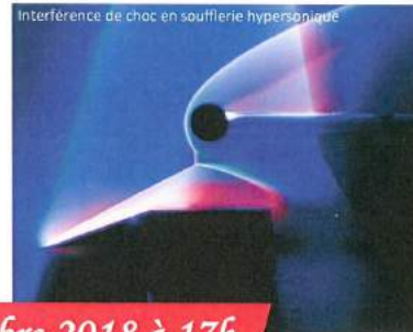
Interférence de choc en soufflerie hypersonique